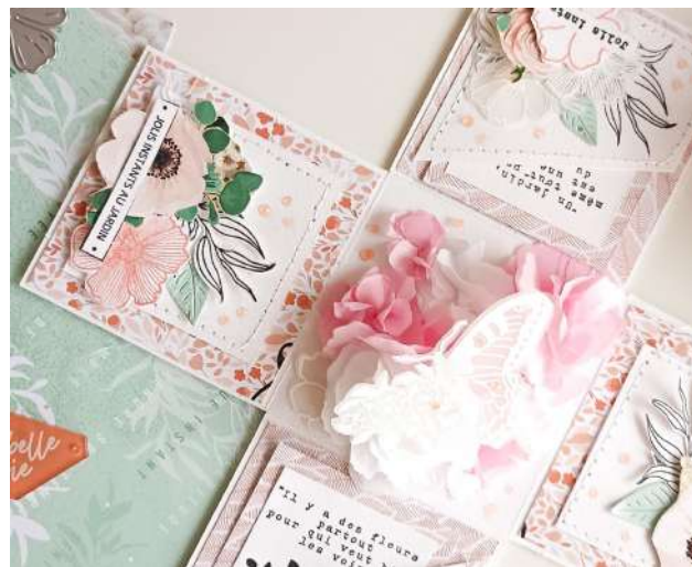
Fiori su vellum / Papillon sur calque